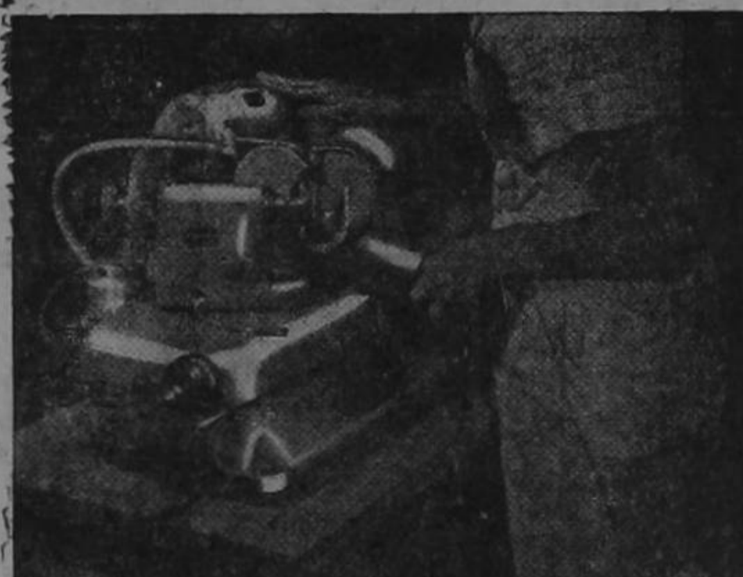
Máquina para Rectificar Válvulas

..¡PRECISIÓN!... ..¡RAPIDEZ!.. en sus trabajos de taller con Black & Decker el "Cuartel General" de las HERRAMIENTAS ELÉCTRICAS