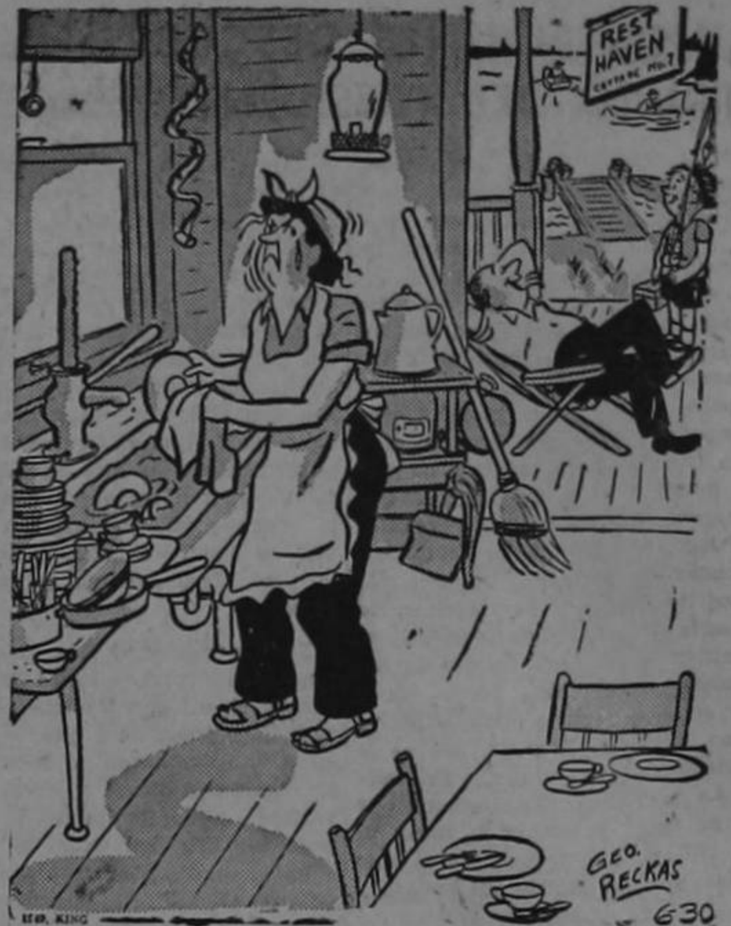
—¡Hijo mío, esto es vivir...!

—¡Oh, es imposible hijo mío! —respondió el director—. ¡El médico dijo que usted padecía del hígado y eso puede hacerle mal...!