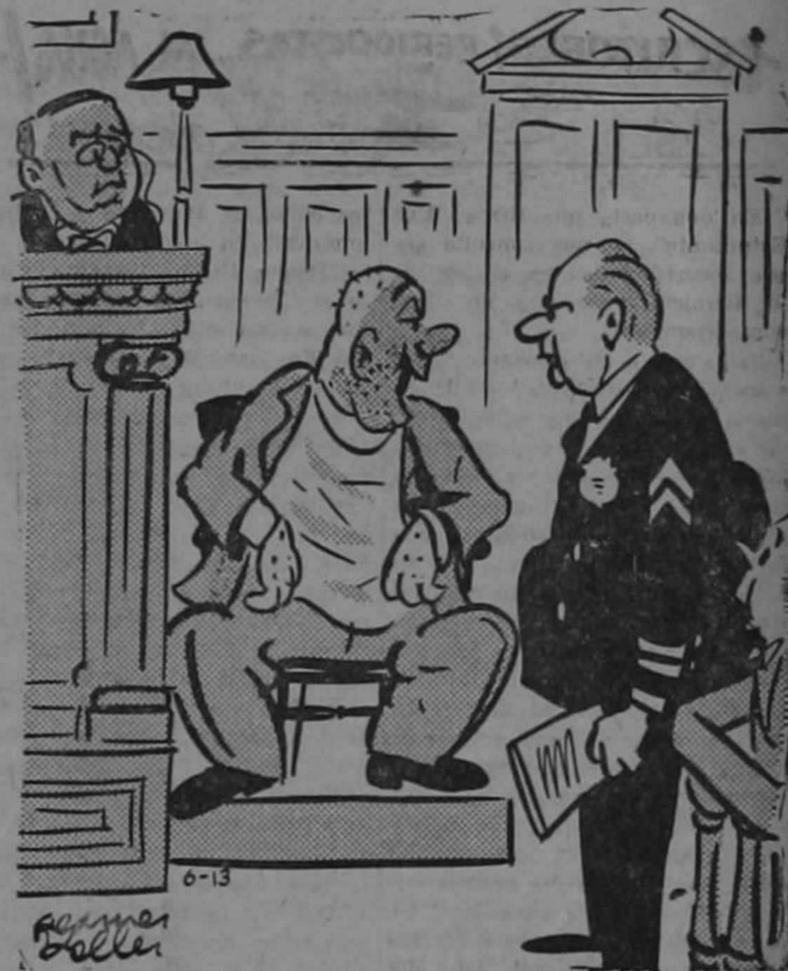
¿Me puede facilitar un cojín, mi estimado...?