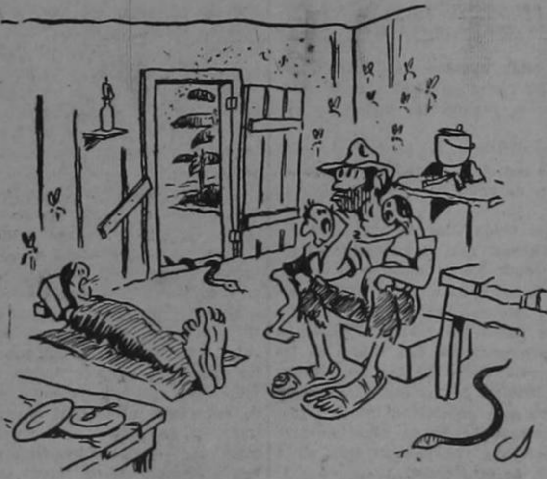
Y como viven los trabajadores costarricenses...

...Y la compañía bananera, no conforme con dar un plato de lentejas por la flor de la riqueza nacional, pretende ahora librarse de los tributos que paga hasta el más humilde pulpero. Y algo más: