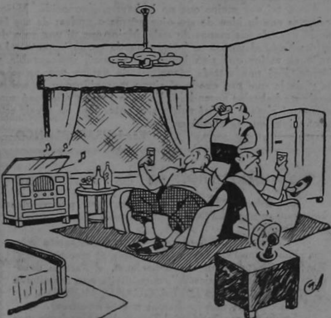
Como viven los gringos...